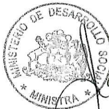
MARÍA FERNANDA VILLEGAS ACEVEDO MINISTRA DE DESARROLLO SOCIAL

POR ORDEN DEL PRESIDENTE DE LA REPÚBLICA