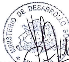
MARIA FERNANDA VILLEGAS ACEVEDO MINISTRA DE DESARROLLO SOCIAL