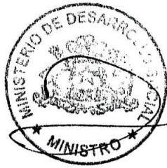
MARCOS BARRAZA GÓMEZ MINISTRO DE DESARROLLO SOCIAL

POR ORDEN DE LA PRESIDENTA DE LA REPÚBLICA