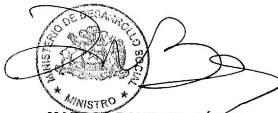
MARCOS BARRAZA GÓMEZ MINISTRO DE DESARROLLO SOCIAL

POR ORDEN DE LA PRESIDENTA DE LA REPÚBLICA