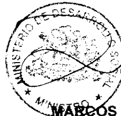
MARCOS BARRAZA GÓMEZ MINISTRO DE DESARROLLO SOCIAL

AVANCEMOS JUNTOS Organización comunitaria de Personas en Situación de Discapacidad RUT: 65.089.565-7