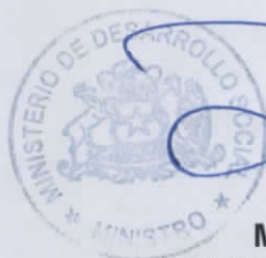
MARCOS BARRAZA GÓMEZ MINISTRO DE DESARROLLO SOCIAL

“POR ORDEN DE LA PRESIDENTA DE LA REPÚBLICA”