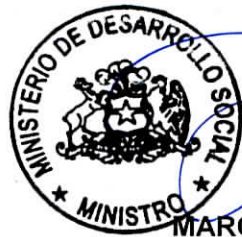
MARCOS BARRAZA GÓMEZ MINISTRO DE DESARROLLO SOCIAL